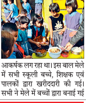
आकर्षक लग रहा था। इस बाल मेले में सभी स्कूली बच्चे, शिक्षक एवं पालकों द्वारा खरीददारी की गई। सभी ने मेले में बच्चों द्वारा बनाई गई

बगबुड़ा। शासकीय प्राथमिक शाला बगबुड़ा में बस्ता मुक्त शनिवार को बाल मेला का आयोजन किया गया। इस आयोजन में कक्षा पहली से पांचवीं तक के बच्चों द्वारा विभिन्न प्रकार के सामग्रियों का स्टाल लगाया गया। इसमें इडली, आलू नड्डा, समोसा, भजिया, आलू चाट, मूंगफली, टो स्टाल, ब्रेड पकोड़ा, खिलौना बच्चों द्वारा बनाकर सजाया गया, जो